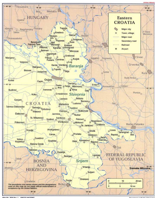
MAP 4. EASTERN CROATIA - Visinski Court Books - Mosaic of Al. 21-95-1311 Sremska Mitrovica added by ICTY/019 map Exhibit 103